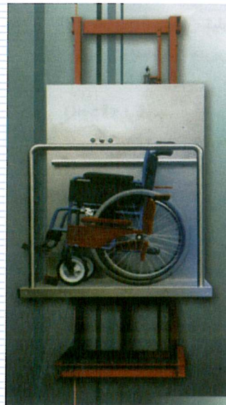
بالابر ویلچر بر هیدرولیک